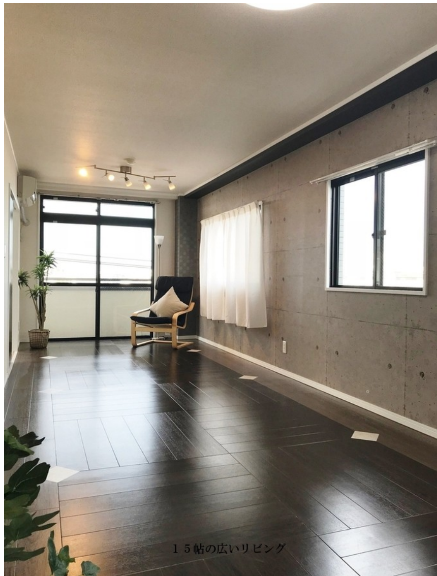
1.5帖の広いリビング