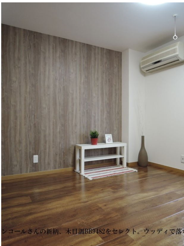
シコールさんの新柄、木目調BB9482をセレクト。ウッディで落ち