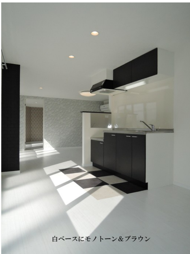
白ベースにモノトーン&ブラウン