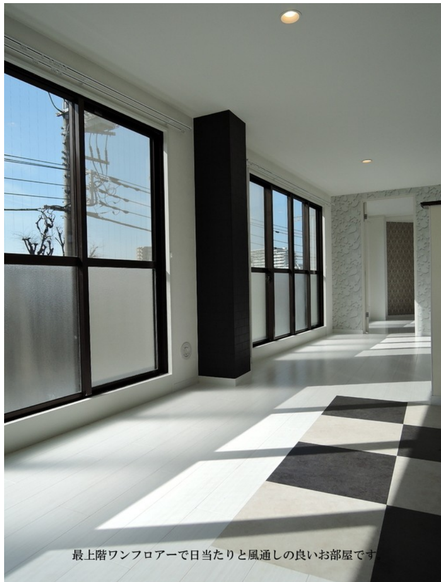
最上階ワンフロアで日当たりと風通しの良いお部屋です