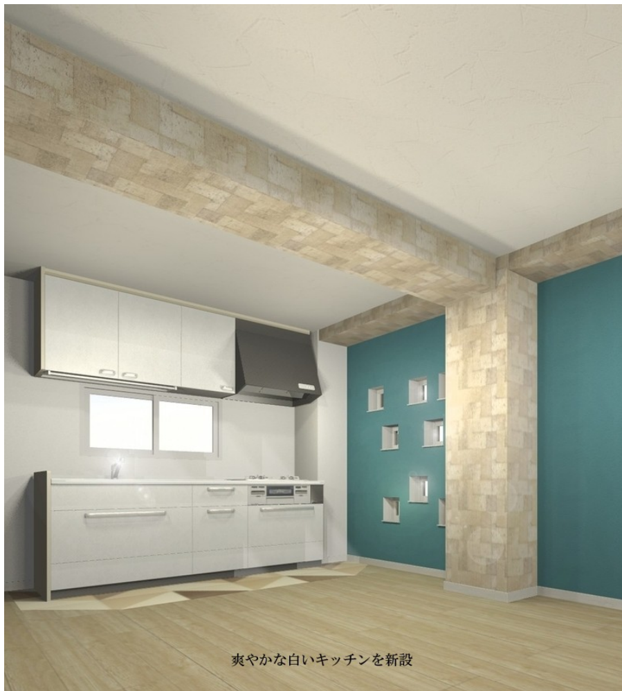
爽やかな白いキッチンを新設