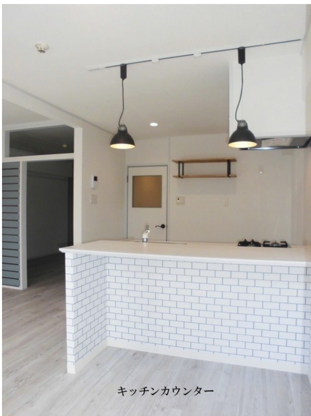
キッチンカウンター