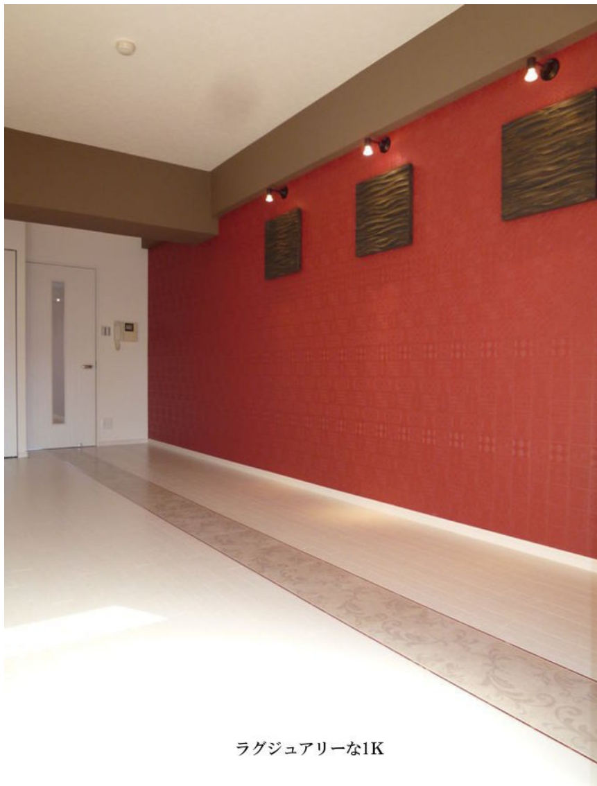
ラグジュアリーな1K