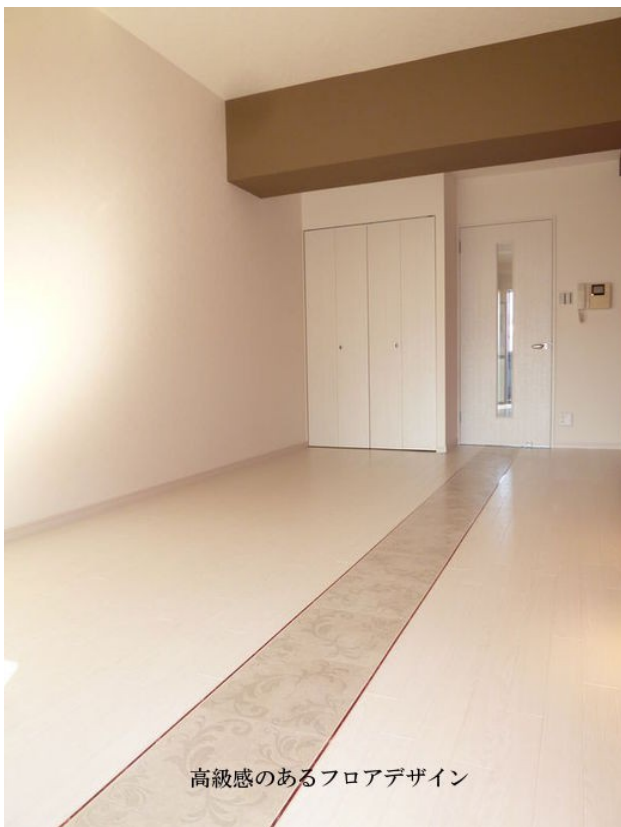
高級感のあるフロアデザイン