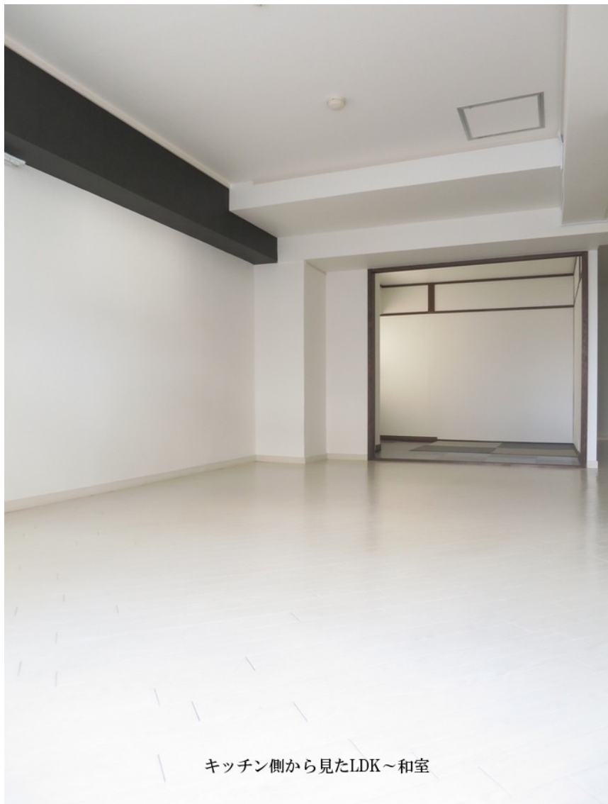
キッチン側から見たLDK～和室