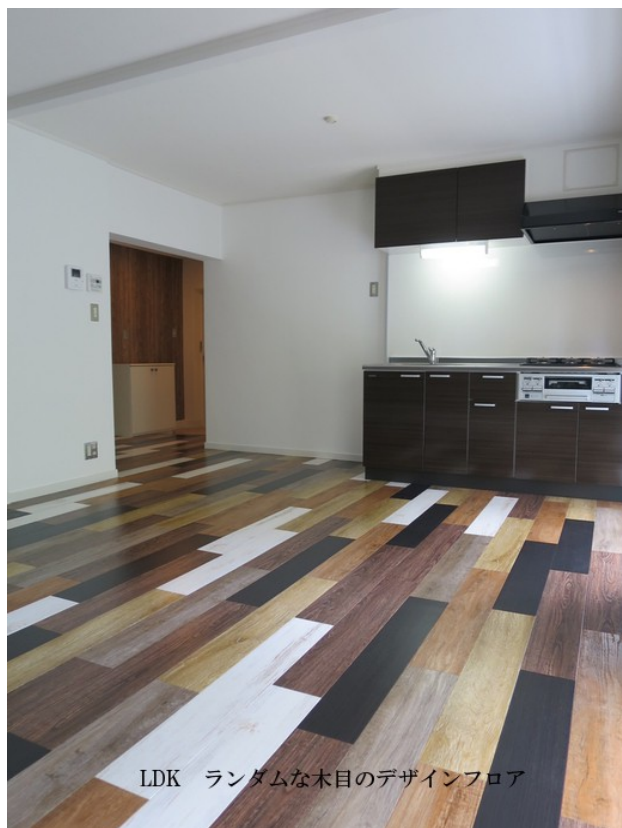
LDK ランダムな木目のデザインフロア