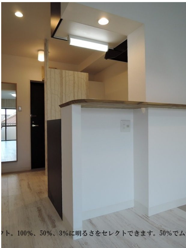
ト。100%、50%、3%に明るさをセレクトできます。50%でム