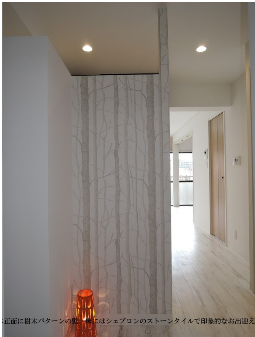
正面に樹木パターンの壁、床にはシェブロンストーンタイルで印象的なお出迎え