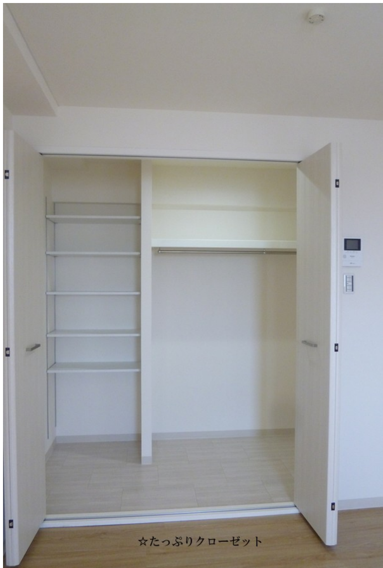
☆たっぷりクローゼット