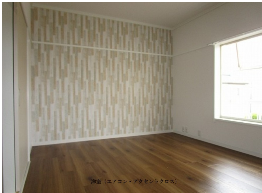
洋室 (エアコン・アクセントクロス)