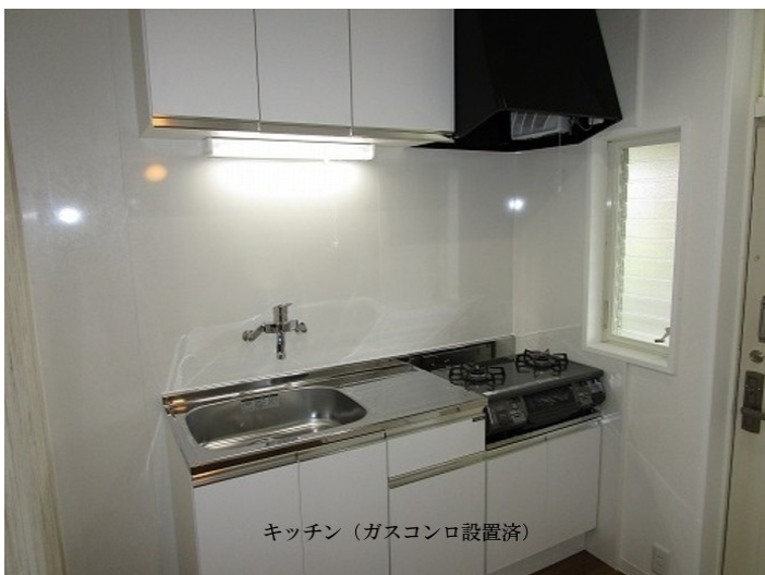
キッチン (ガスコンロ設置済)